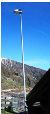
TP1 ( INTERRATA)