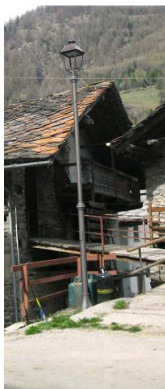
PLM08( LED – INTERRTA)