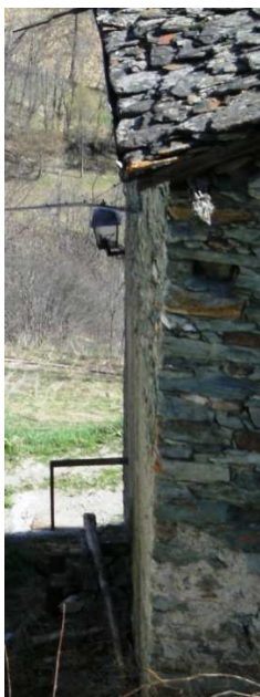
LM03 ( AEREA)