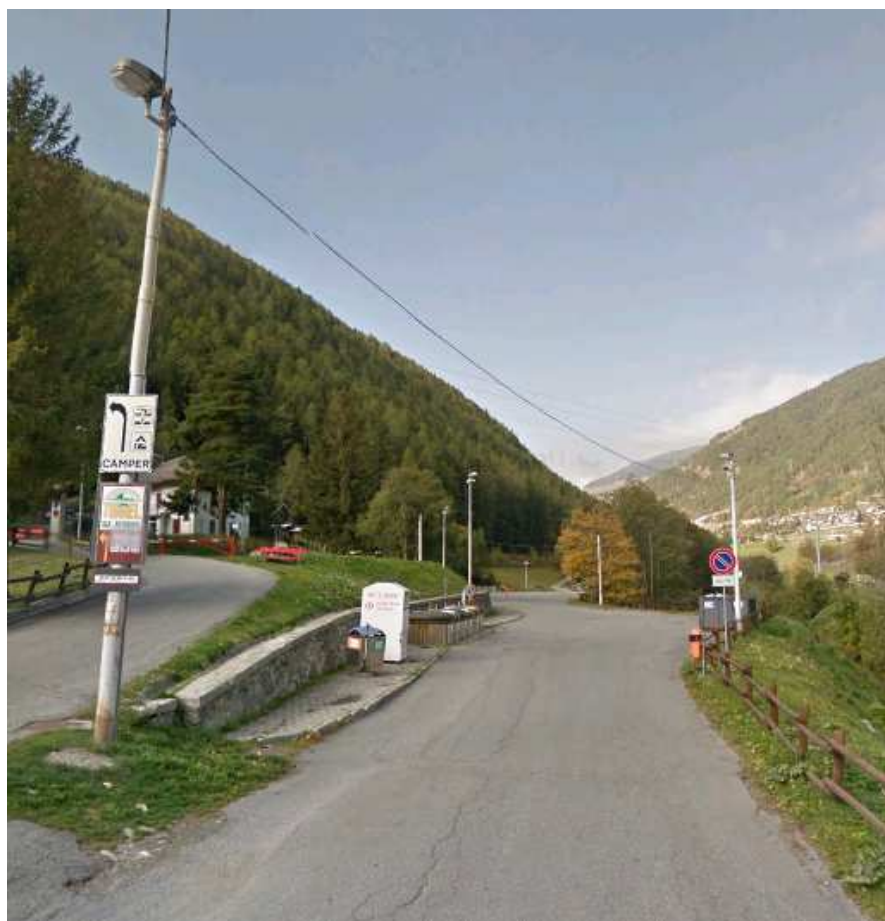
LANTERNE Z. FIERA TP77-90