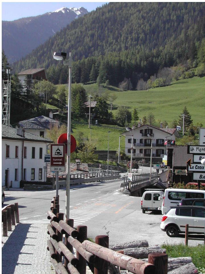
LANTERNE ZONA PONTE TP 113-100