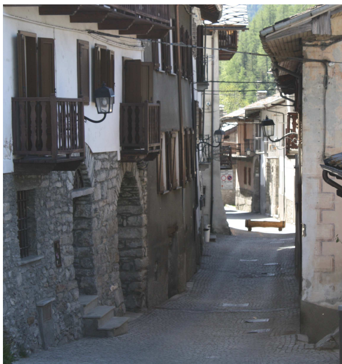
LANTERNE A MURO INIZIO BORGO LM41-42