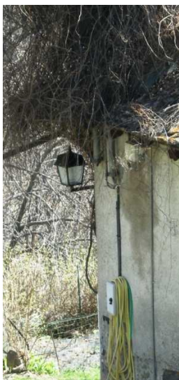
QUADRO ELETTRICO CON PUNTO LUCE LM06 (AEREA)