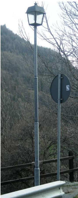
P L2 – PL3

Q5 – QUADRO ELETTRICO DA 1,5 - 3 KW MONOFASE