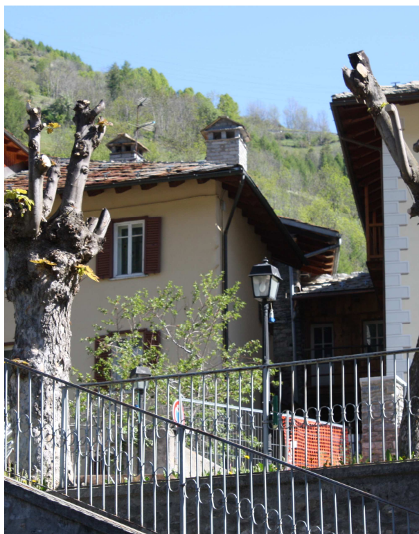
LANTERNA BOFFINO SU PALO ZONA CHIESA PL48