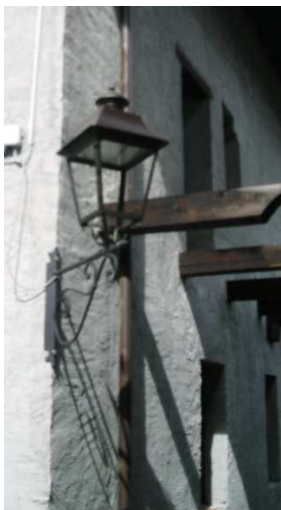
LM04 ( LED –( INTERRTA)