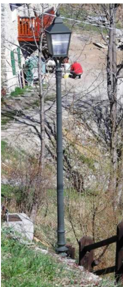
PL5 ( INTERRATA)