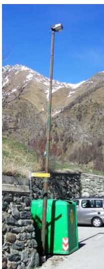
TP5 ( INTERRATA)