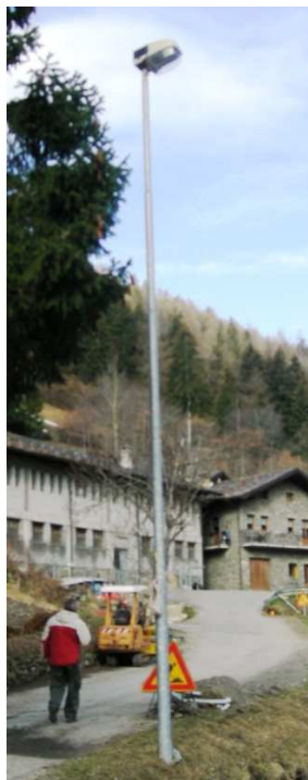
TP1 – TP2 – TP3 – TP4 – TP5 –TP6 – TP7 – TP8 – TP9 – TP10 - TP11 (INTERRATA)