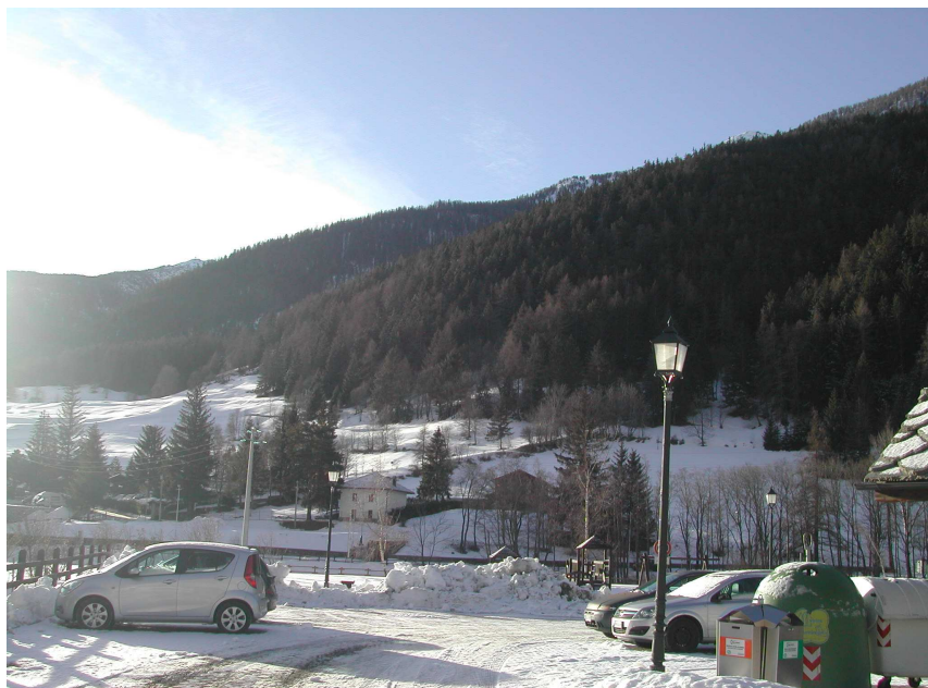
LANTERNE PIAZZALE BAR PL58-60