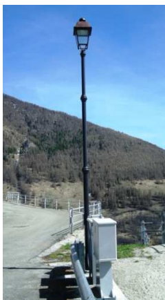
QUADRO CON PL1 (LED INTERRATO)