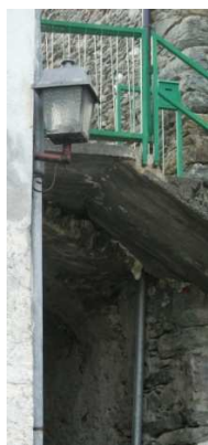
LM7 ( INTERRATA)