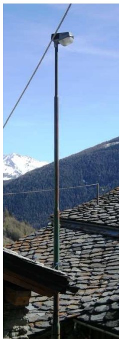
TP1 ( INTERRATA)