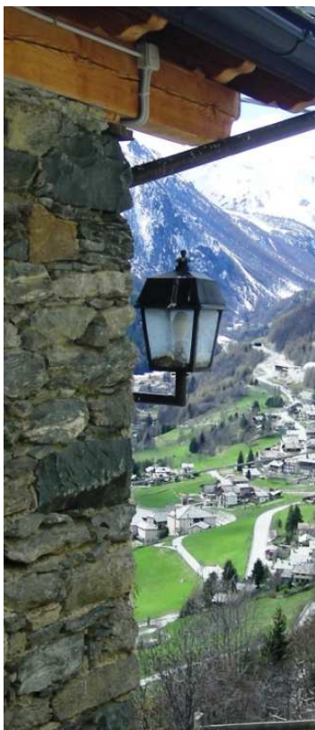
LM2 (STAFFATA A MURO)