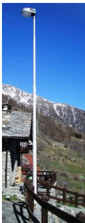
TP2 ( INTERRATA)