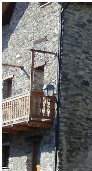
LM05 ( INTERRATA)