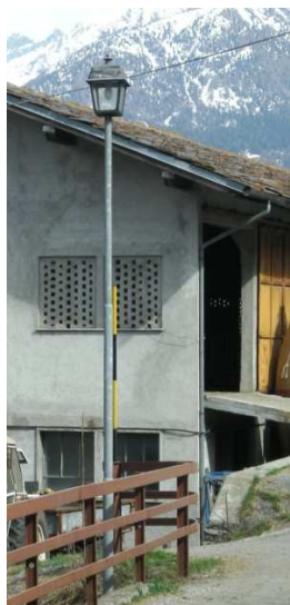
PL2 ( INTERRATA)