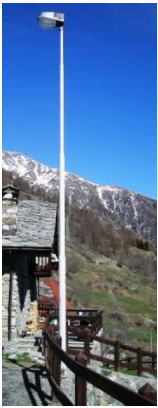
TP3 ( INTERRATA)