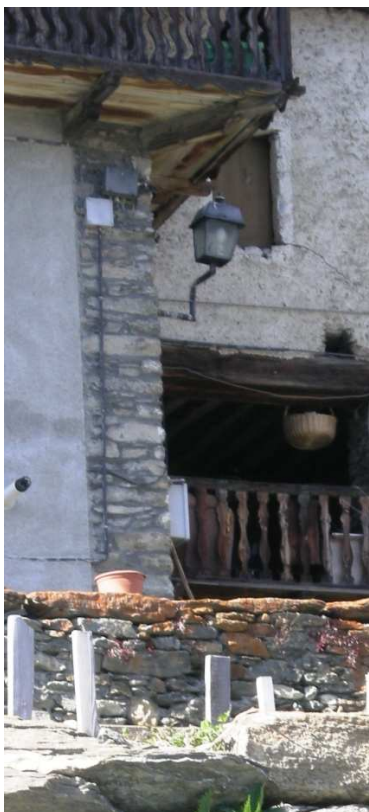
QUADRO CON PUNTO LUCE LM05