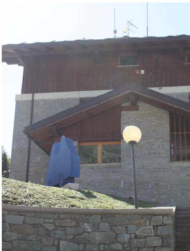
LANTERNE A BOCCIA MUNICIPIO TPP1-TPP12