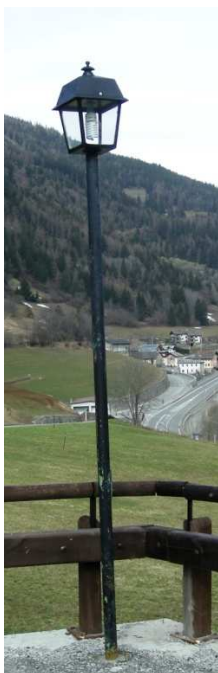
PL1 – PL2 – PL3 - PL4 – PL5 – PL7 (INTERRATA)