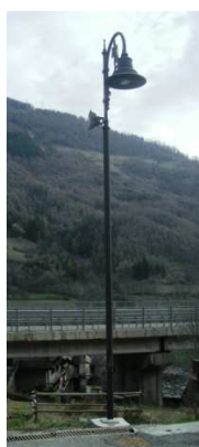
PLF14 – PLF15 – PLF16 (INTERRATA)