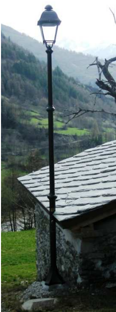
PL6 ( LED – INTERRTA)

Q5 – QUADRO ELETTRICO DA 1,5 - 3 KW MONOFASE