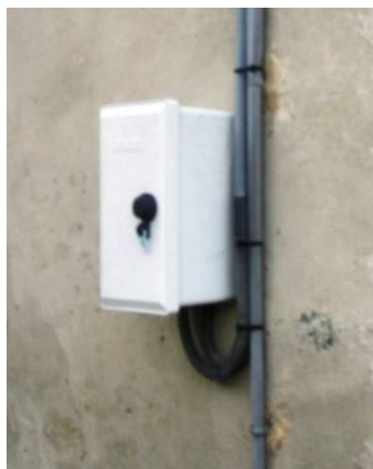
GRUPPO DI MISURA