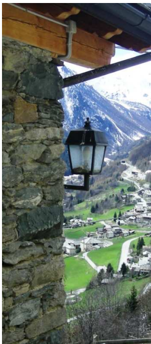
LM1 – LM2 – LM3 – LM4 LM5 (AEREA)