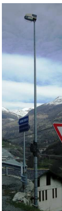
TP6 ( INTERRATA)