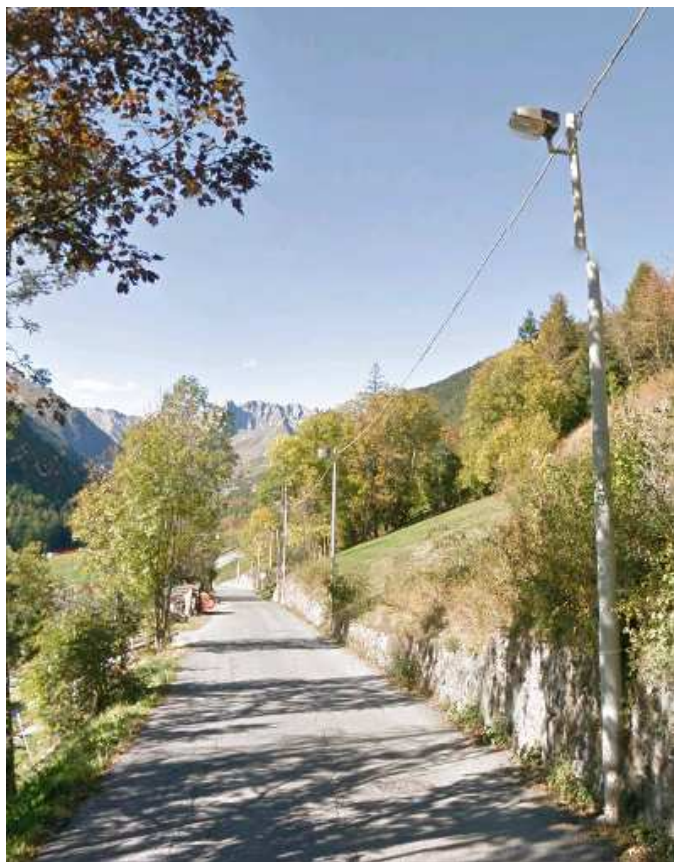
LANTERNE E PALI SALITA VACHERY