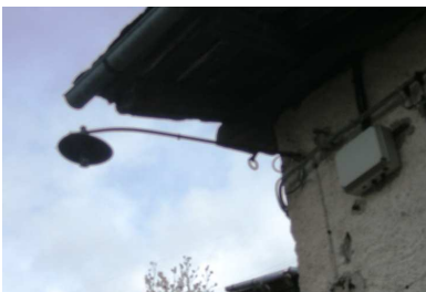
LM01 ( AEREA)