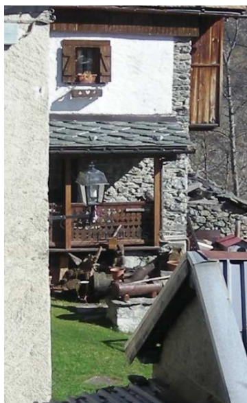
LM02 – LM03 – LM04 (INTERRATA)