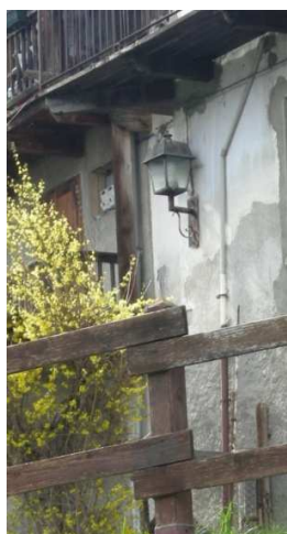
LM02 – LM03 (AEREA)