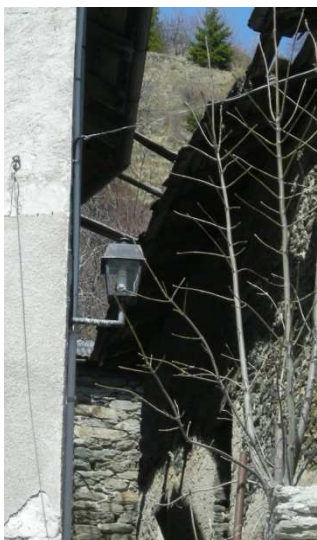
LM2 ( AEREA)