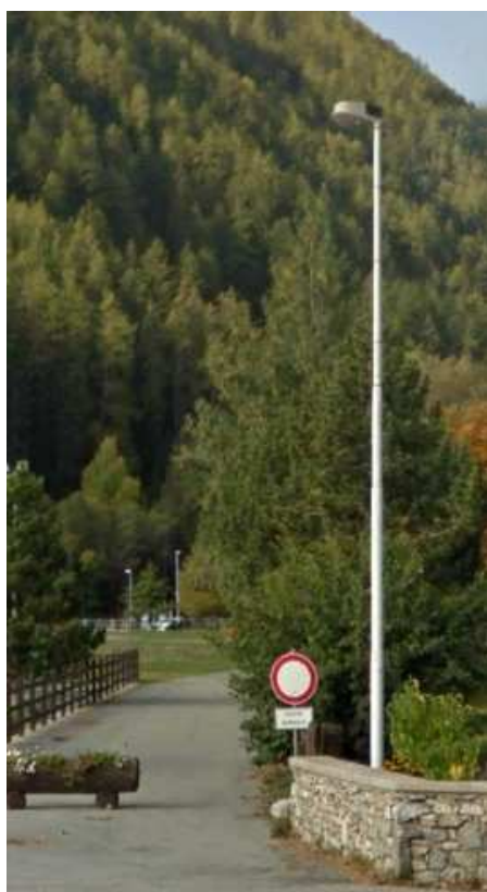
LANTERNE PISTA DI FONDO