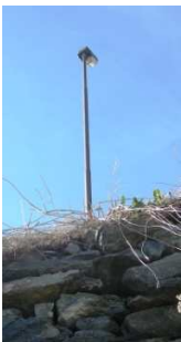
TP4 ( INTERRATA)