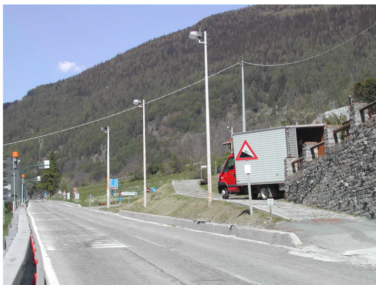
LANTERNE ZONA ALTA TP125-127