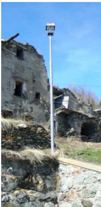
PRED3 ( INTERRATO)