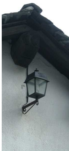
LM01 – LM04 – LM05 ( AEREA)