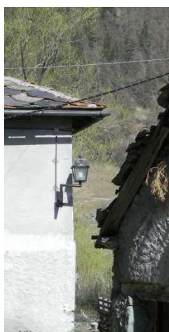
LM04 – LM05 –LM07- LM 08 (AEREA)