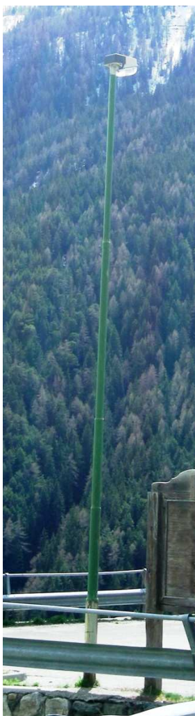
TP1 – TP2 – TP3 – TP4 – TP5 ( Z1 – INTERRATE)