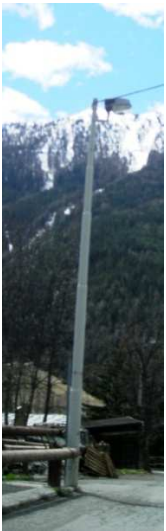
TP25 ( AEREA)