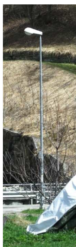
TP22 ( INTERRATA)