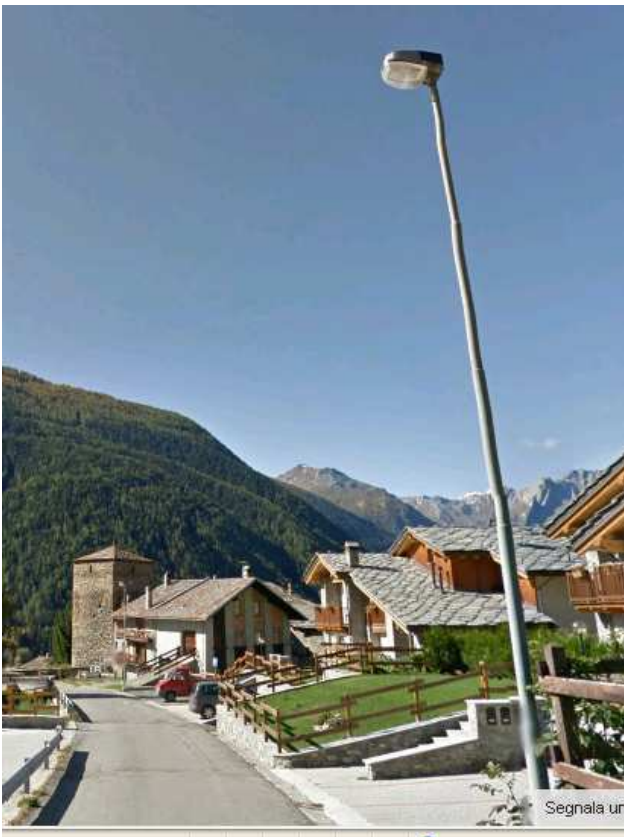
TP49-55 ( INTERRATA)