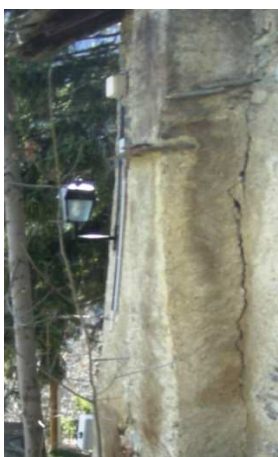
LM03 ( SU PARETE)