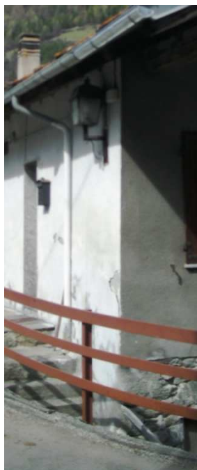
LM01- LM06 – LMO7 – LM08 - LM09 – LM10 (AEREA)