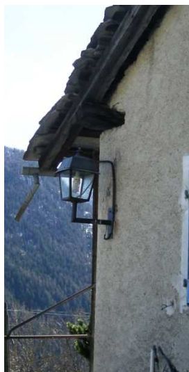
LM01 ( INTERRATA)